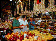
The French Market